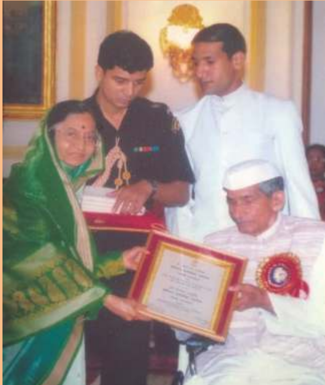
राष्ट्रपति सम्मान प्राप्त करते हुए