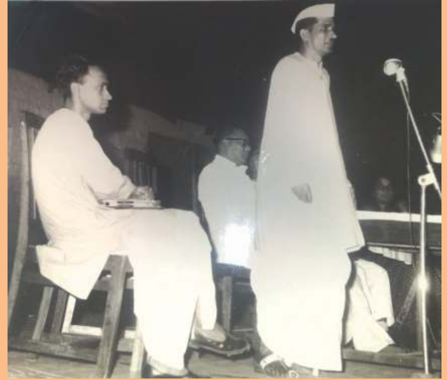
ब्याख्यान देते हुए