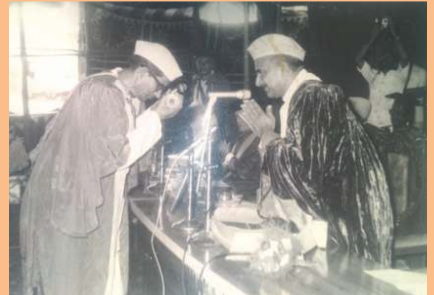
सागर विश्वविद्यालय से डी.लिट. की उपाधि प्राप्त करते हुए